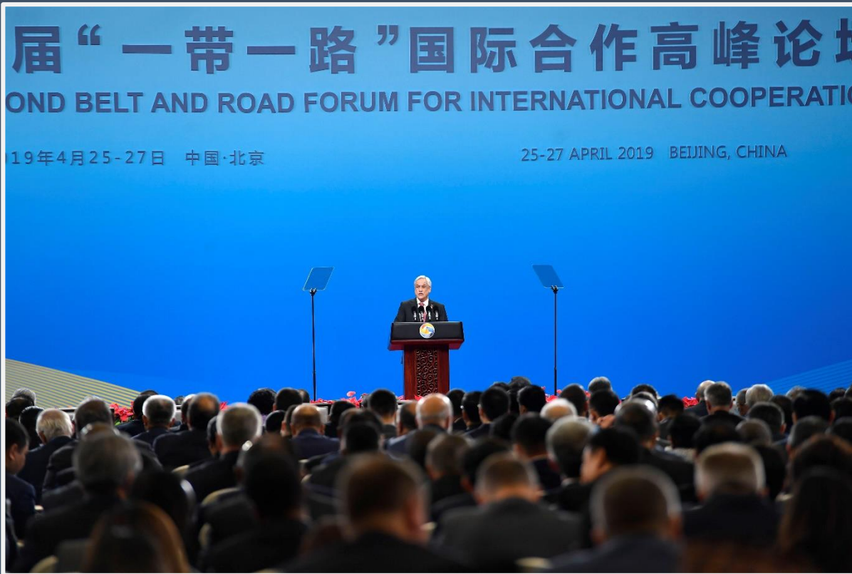
Discurso de S.E. Presidente Piñera en el II Foro “Una Franja, Una Ruta” 25-27 de Abril, Beijing, China

“ Chile está preparado para transformarse en una puerta de entrada de Asia a América Latina.