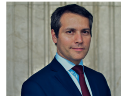
RODRIGO YÁÑEZ Subsecretario de Relaciones Económicas Internacionales Ministerio de Relaciones Exteriores

En los próximos diez años de la Alianza del Pacífico deberemos ser capaces de profundizar esta área de integración que hemos logrado, siempre enfocados en el bienestar de nuestros ciudadanos y ciudadanas y con el objetivo de lograr hacia 2030 la visión que se planteó en la creación de nuestro mecanismo regional.