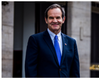
ANDRÉS ALLAMAND Ministro de Relaciones Exteriores